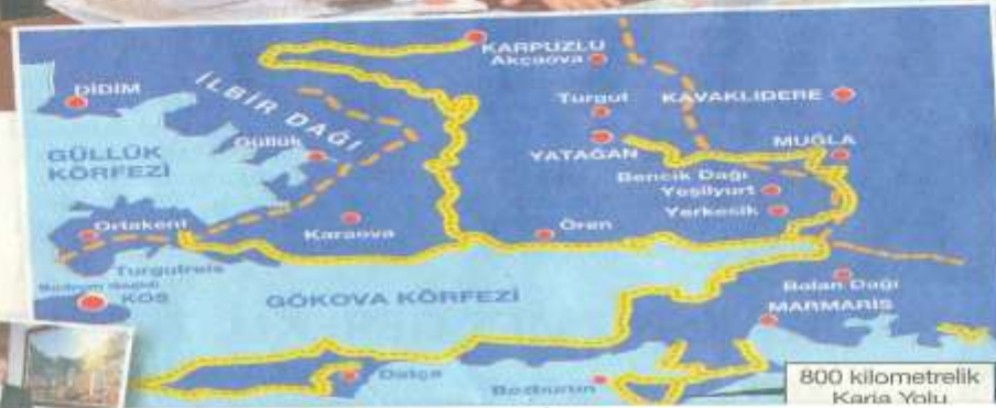
800 kilometrelik Karia Yolu