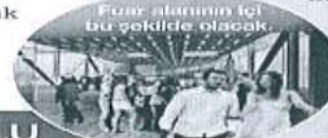
Fuar alanının içi bu şekilde olacak

aşamasında ve daha sonraki fuar alanının yavaş yavaş ortaya çıkmasından itibaren çok daha fazla kurumun bunu sahipleneceğini düşünüyorum. Sembolik olarak ilçe odalarımız buraya ortak. Esnaf odamız da ortak. Odalarımızın manevi