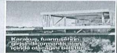
Karakuş, fuar alanının girişinde ormanlık alan içinde olacağını belirtti.

Fuar alanıyla ilgili bir şirket kurulmasına karar verdikleri dile getiren Başkan Karakuş, "Güney Ege Kalkınma Ajansı'ndan aldığımız 3 milyon lira güdümlü proje desteği var. Şu anda bu projenin 8 milyon liralık kısmı hazır. Bu projenin