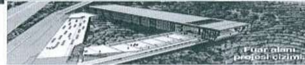
Fuar alanı projesi çizimi

Yeni fuar alanıyla ilgili projelerin bittiğini ve belediyeden ruhsat alma aşamasında olduklarını Başkan Karakuş, "Mimari olarak farklı bir fuar alanı yapmak istiyoruz. Toplam 5 bin metrekare kapalı alana sahip olacak fuarda, katlı otopark yer olacak. Böylece çok fazla ağaç da kesmeyeceğiz. Fuar alanı için Milli Emlak'a ait olan araziyi kiralandık. Projenin temelini 6 ay içinde atmayı ve 1.5 yıl içinde tamamlamayı planlıyoruz. Yaklaşık 4 yıldır bu proje üzerinde çalışıyoruz. Ancak bürokratik engelleri aşmak zaman